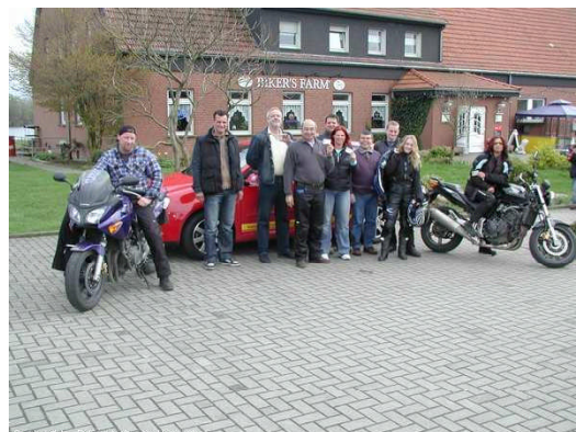
Der erste Intensivkurs im April 2005 mit 8 Teilnehmern und 100 % Erfolg: Alle haben bestanden!